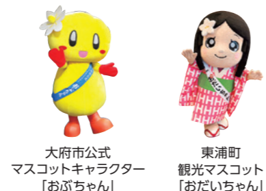
大府市公式 マスコットキャラクター 「おぶちゃん」