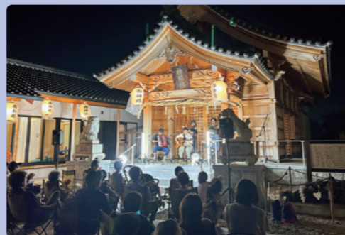
ハツ屋神明社をバックに幻想的な雰囲気の中演奏!