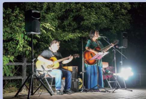
夏の川辺でギターの音色と歌声が響き渡る