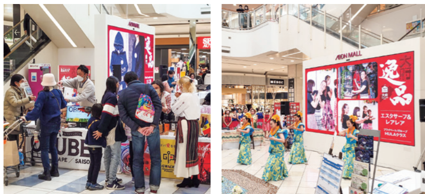
令和5年おおぶ・東浦逸品展示会