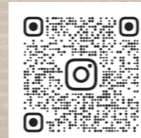
Instagram 公式アカウント (@obu_meguru)