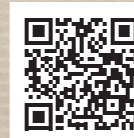
大府商工会議所 WEB サイト

大府商工会議所ホームページまたは Instagramをご確認ください! 冊子のデータ版や応募方法を掲載しています!