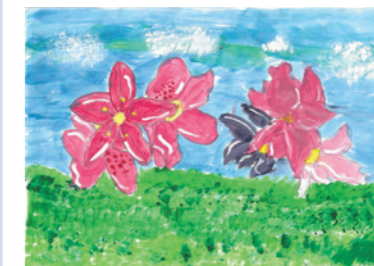
新海史織さんの作品