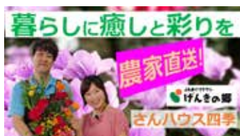
げんきの郷 さんハウス四季