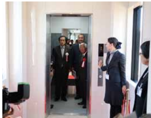
エレベーター初乗りです!