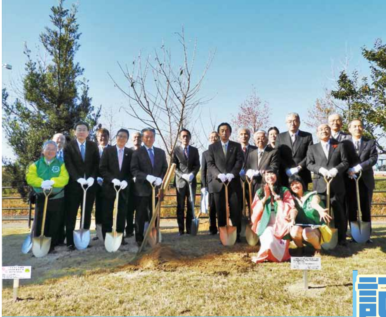
ハナモモ植樹 1,000 本達成