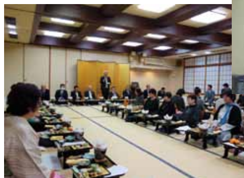
多数のご来賓に参加いただきました