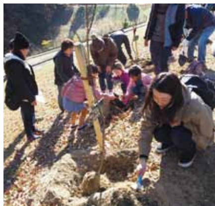
ハナモモ植樹を楽しむ親子

大府商工会議所主催、花まるOBUプロジェクト共催、東浦町商工会協賛による第5回ハナモモの木記念植樹祭が「あいち健康の森薬草園」で行われました。5年間で1,000本のハナモモの木を植え、大府・東浦に桃源郷をつくらうのスローガンを掲げて平成26年3月から始まったこの事業は、今回植える180本を加えると1,050本になり、1年前倒しで目標を達成する運びとなりました。このため、来賓として岡村大府市長をはじめ、