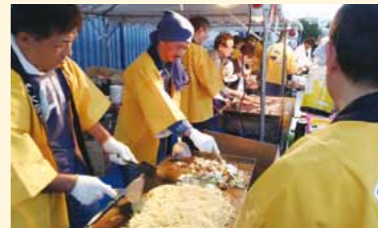
▲役員が腕をふるい、焼きそばを作ります

横北支部の役員が料理の腕を振るい、焼きそば・焼肉・たこ焼き・みたらし団子等を参加者の皆様に提供しました。