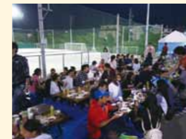
▲さまざまな国籍の方々にも楽しんでいただきました

少し風が強い天候で肌寒く感じましたが、参加者同士楽しみながら、交流を深めることができました。