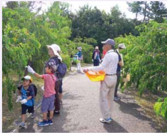
▲シダレハナモモの種収穫風景

平成29年度商工会議所「花いっぱい運動」の1つとして、子どもの緑化意識向上とハナモモの苗木供給を目的に第3回「親子ハナモモの種収穫体験会」をモリコロパークで大人16名、子ども11名の計27名で実施しました。