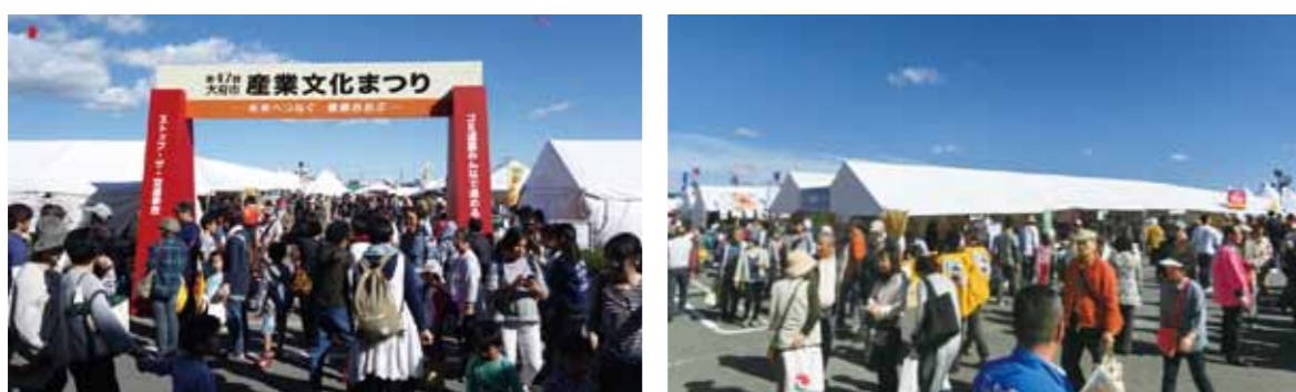
注) 写真はともに昨年の大府市産業文化まつりの様子です。

※催事や各種イベントなど開催しますので、皆様 お誘い合わせの上、是非ご来場ください。