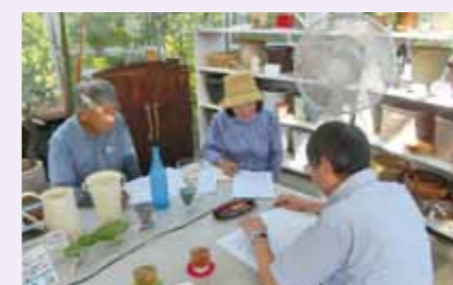
▲個店訪問アドバイスの様子