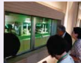
▲抹茶製造室の様子