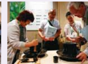
▲茶臼体験もできました!