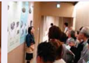
▲抹茶ができるまで