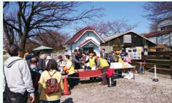
▲ミルクショップ知多農場でのおもてなし風景

2つは、NPO法人東知多菜の花プロジェクト主催の第8回おおぶ菜の花祭りです。げんきの郷をメイン会場で行われ、6haの菜の花めぐり、今年から初めて行われた“親子菜の花摘み体験”そして330名の出演者の、華やかなステージイベントなど3,500人の参加者が大府の春の“健康と花のピックイベント”を楽しまれました。