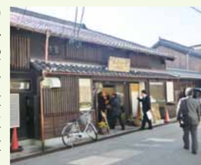
▲町屋を改修した食事処「ハハトコ食堂」

大府市と比較すると、人口ほぼ同じ、総面積約17倍、製品出荷額0.8倍、小売業販売額1.2倍、商工業者数・小規模事業者数ほぼ同数、商工会議所会員数0.8倍といった状況です。