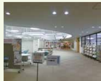
▲ハイトピア伊賀館内 市民の憩いスペースも併設

今年度は、中心市街地活性化の取り組みを学ぶため、19名にて上野商工会議所(三重県)を視察しました。