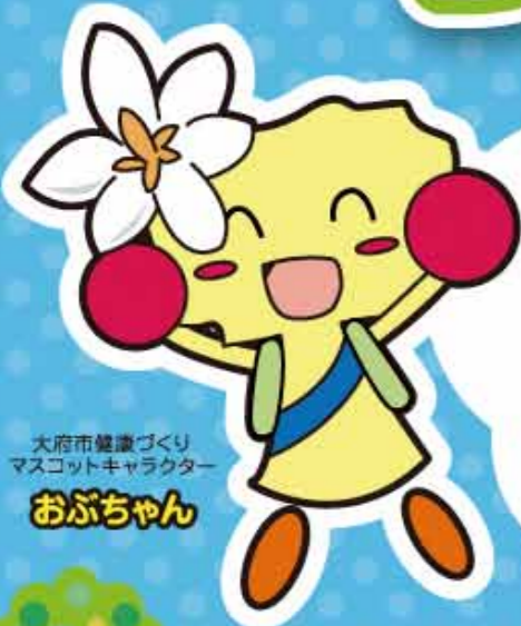
大府市健康づくりマスコットキャラクター おぶちゃん