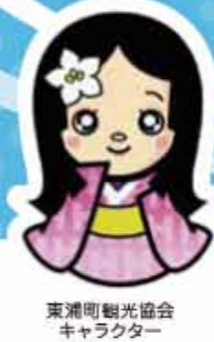
東浦町観光協会キャラクター おだいちちゃん