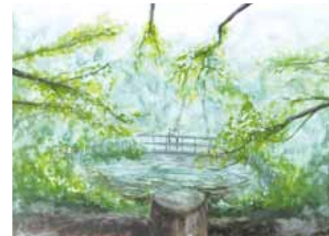
▲深谷将之さんの作品