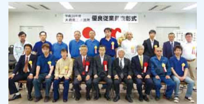
永年勤続者表彰を受けた方々