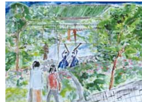
▲藤田由紀子さんの作品