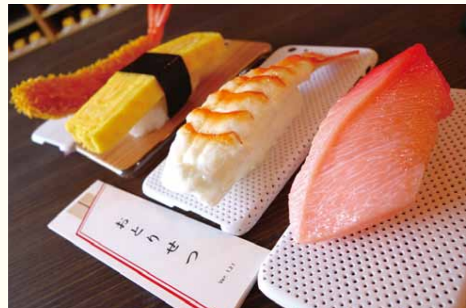
「スシーン」のベースはシャリをイメージした白と、まな板を連想させる木目調。奥にはカラリと揚がった名古屋めしシリーズの「エビフリヤー」も。

精巧かつ頑丈に作られたケースは、食品サンプルの元祖・郡上八幡の岩崎模型製造の指導を受け、梶川さんご本人が夜な夜な作っています。物腰柔らかで聞き上手、話し上手、さらに手先が器用。開発までの経緯にも、その佇まいのヒミツがありそうですが…。