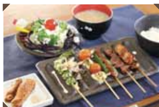
健康鶏づくし定食