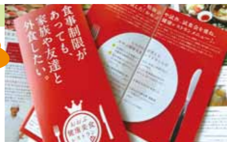
「おぶ健康美食レストランメニュー」のチラシがいに完成!