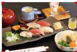
おまかせ握り健康食楽セット

えみのわ活動理念 大府に根ざした活動を通し 地域に笑顔を増やしていく えみのわ 大府で検索!