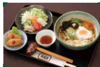
野菜たっぷりあんかけうどん