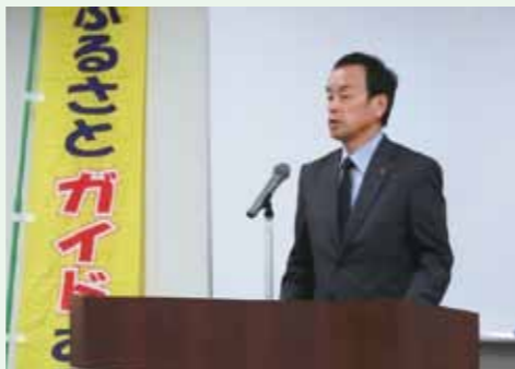
▲総会にて祝辞を述べる岡村市長

総会では、その成果物として2年の歳月をかけて手作りの4つのコースパンフレットが披露され、パンフレットはコース参加者へ販売を予定しています。今後は、このパンフレットを使用し地域関係団体・施設と連携をしつつ、『健康都市大府』の特徴を活かした“健康を語るガイド”として観光客を呼び込む活動が行われます。当商工会議所としても、連携を図りながら地域活性化へ向け支援を続けて参ります。