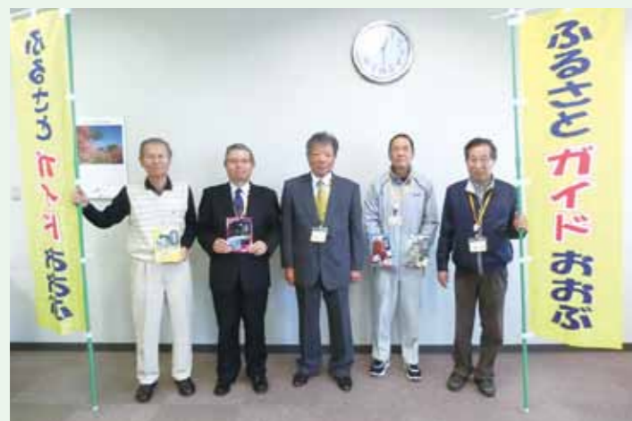
▲ 阪野会長(中央)はじめガイド会員の皆様