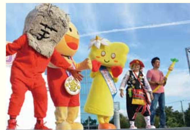
大府のゆるキャラとステージ上で共演。