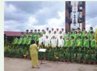
▲地元コーラスグループによる合唱披露

「菜の花畑めぐり&菜の花ウォーキング」も始まり、4ヶ所の菜の花畑を巡るスタンプラリーで3ヶ所スタンプを押した参加者には、温かい味噌汁が振舞われました。