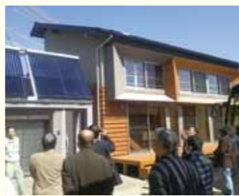
▲ゼロエネ住宅を見学

木材流通の合理化や木造住宅の建設促進に取り組み、国産材と職人の技術で、日本に合った住宅の普及に努めています。木材市場の見学後、モデルハウス(東濃型ゼロ・エネルギー木造住宅)に案内していただきました。冬暖かく、夏涼しい究極の高断熱住宅とのことでしたが、地域によって気象条件が異なるため、気象データをもとに設計することが大切で、地域の工務店や大工さんの腕の見せ所であるとのことでした。