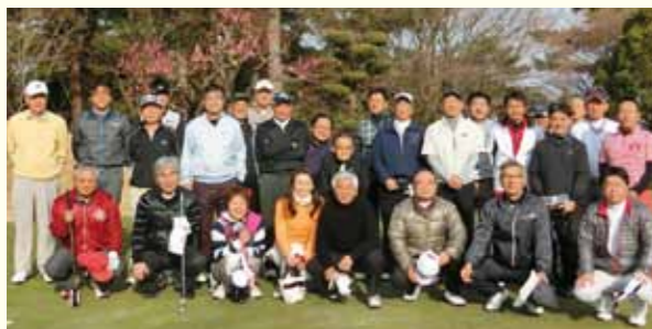
第26回結果発表 (敬称略)

大府商工会議所では、年2回(春・秋)ゴルフコンペを開催しています。奮ってご参加ください。