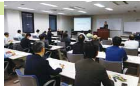
省エネセミナー&補助金説明会 (2016/3/14)