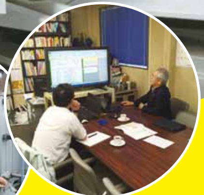
▲事前チェックシートで検討