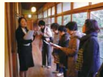
▲専任ガイドの説明を受ける一行

今回は、伊豆修善寺温泉にある文化財の宿「新井旅館」を訪れ、日本文化に触れ、その価値や保護について認識を新たにしました。