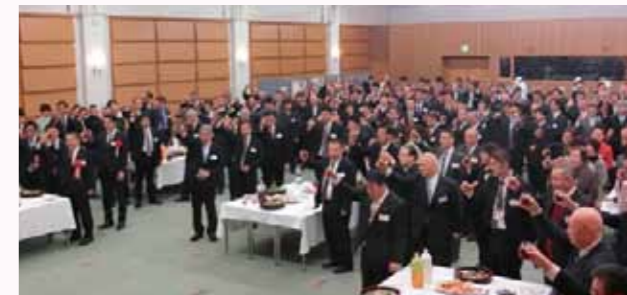
▲愛知県議会議員の深谷勝彦氏のご発声で乾杯!