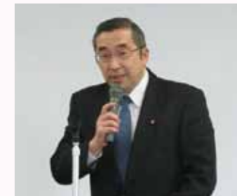
▲鈴木淳司経済産業副大臣

大半の地域では、7割以上の従業員が中小企業・小規模事業所に勤務している現状を踏まえ、様々な支援策を打ち出していくとのこと。最低賃金の引上げに向け、生産性の向上等のための支援や取引条件の改善等をすすめ、経済強化を図るとし、特に、地域経済の活性化・「稼ぐ力」を強化するため、地域を牽引している(できる)「地域中核企業支援」を創出し、支援する事業に力を注いでいきたいと力説されました。