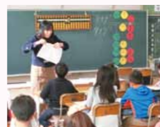
▲真剣に授業に取り組む児童達 (1月14日石ヶ瀬小学校にて)

授業では、そろばんに初めて触れる子供でも興味を持ち、楽しく理解できるように心がけ、教材にも工夫を凝らして教えています。