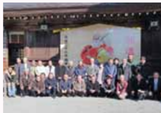
▲豊川稲荷で記念撮影

日本三大稲荷「豊川稲荷」では、商売繁盛と家内安全を祈願、ご祈禱を受けた後、精進料理をいただきました。帰途、一色さかな市場で、お土産を購入し、御利益と共に大府に帰りました。