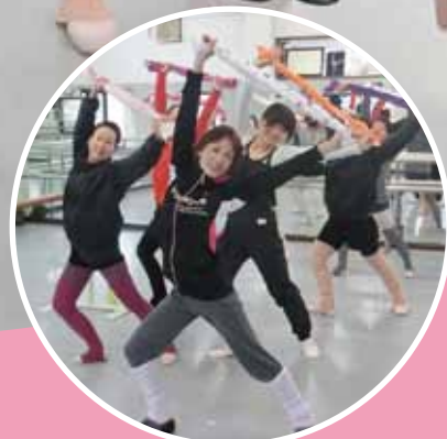
▲骨盤エクササイズ

平成27年度確定申告書作成指導日 ~準備はお早めに~ 2/22(月)・2/23(火)・2/24(水)・3/1(火)・3/2(水) 時間:13:30~15:30 場所:大府商工会議所3階大ホール