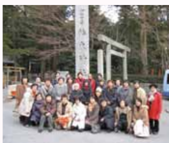
▲椿大神社で記念撮影

1年のお礼と今年の無事を祈願した後、縁起物の熊手や節分の豆を購入し、「福」を大府に持ち帰りました。千代保稲荷の門前町は、相変わらずの盛況振りで、商売繁盛の御利益を目の当たりにしました。