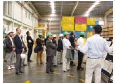
▲豊田通商インディアの物流倉庫見学

11月3日(火)~8日(日)4泊6日で総勢23名にてインド(訪問都市:バンガロール・マイソール)を訪問。JETROでプリーフィング後、会員企業の(株)豊田自動織機の現地企業等を視察し、現地事情等を把握、インドの経済成長を実感する研修となった。