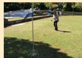
▲グラウンドゴルフのプレー風景