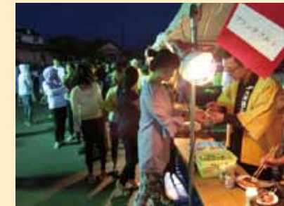
▲フランクフルトには長～い行列

横北支部恒例の月見の会を開催いたしました。支部事業所の社員・家族、支部役員など250名が参加し、今年も盛況となりました。横北支部の役員が料理の腕を振るい、焼きそば・焼肉・フランクフルト等を参加者の皆様に提供しました。少し風が強く肌寒く感じましたが、風流にお月様と食を楽しみながら、家族、仲間、事業所間の交流を深めることができました。