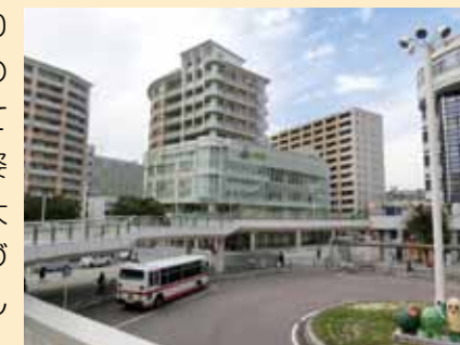
▲再開発後の勝川駅前

当委員会では、引き続き、大府市の中心市街地に賑わいを取り戻し、大府市の玄関口としてふさわしい姿とするため、大府市のまちづくりを検討してまいります。