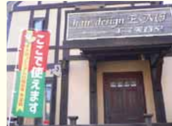
▲赤のぼりは千円券のみ、赤緑のぼりは500円券千円券の両方が使える目印!