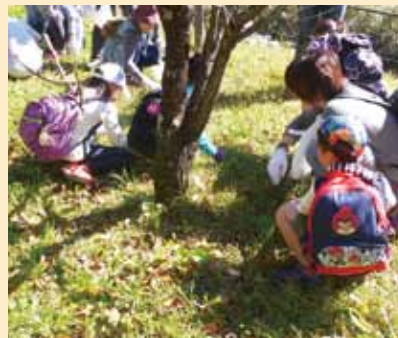
▲ハナモモの種収穫中

今年も昨年に引き続き、子どもの緑化意識向上とハナモモの苗供給を目的に「親子によるハナモモの種収穫体験会」(参加者:大人26名+子供17名)を実施しました。