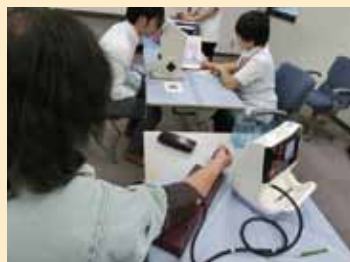
▲視力検査、血圧測定の様子

健康診断は、労働安全衛生法に基づき、従業員を雇用している事業所においては、年1回必ず受診の義務があります。