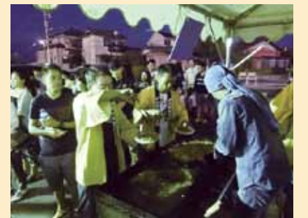
▲焼きそば作りは、なかなかの重労働!

また、横北支部の事業所に勤める外国人従業員の方々にも好評で、ふれあいの場となっています。