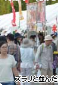
ズラリと並んだ飲食テント