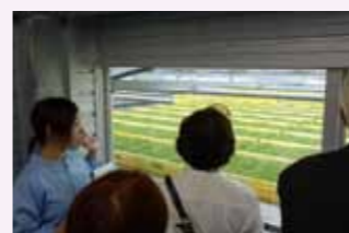
▲すくすく育つ「スプラウト」に感心

大府商工会議所商業部会と情報・物流・サービス業部会は、合同企画により、岐阜県中津川市の株式会社サラダコスモを視察しました。