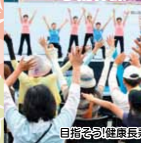
目指そう!健康長寿