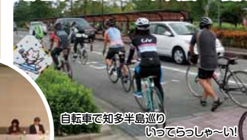
自転車で知多半島巡り いってらっしゃーい!