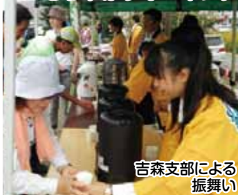
吉森支部による 振舞い