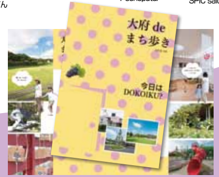
▲大府deまち歩きパンフレット