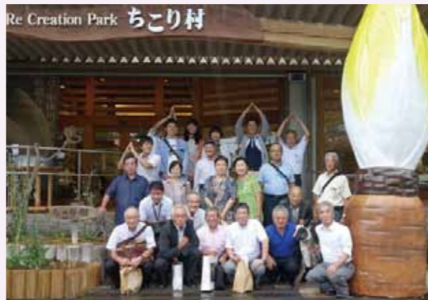
▲参加者一同、ちこりのオブジェと一緒に記念撮影