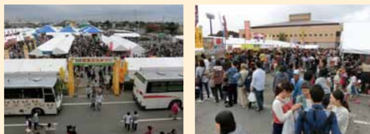
注) 写真はともに昨年の大府市産業文化まつりの様子です。