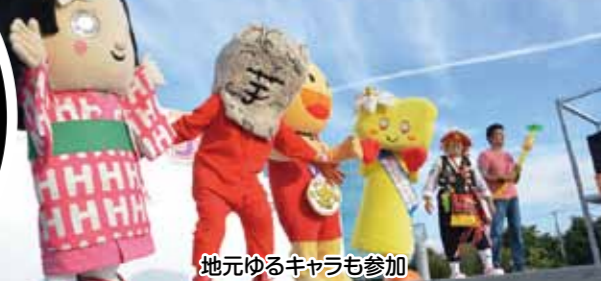
地元ゆるキャラも参加