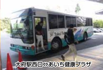
大府駅西口⇄あいち健康プラザ