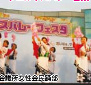
大府商工会議所女性会民謡部