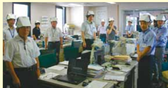
▲備え付けの折りたたみ式ヘルメットも被ってみました!

大府商工会議所は、9月1日(火)、シェイクアウト訓練に参加し、地震から身を守る安全行動(姿勢を低く、頭を守り、じっとする)を1分間行いました。