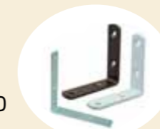
家具転倒防止金具 L字金具