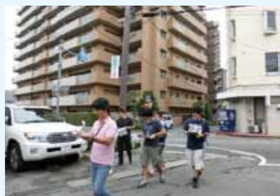
▲調査する工学院大学の学生達

今回は、その一環で、工学院大学遠藤ゼミ生(5名)が、大府市の現状把握のため、7月8日~9日の2日間にわ