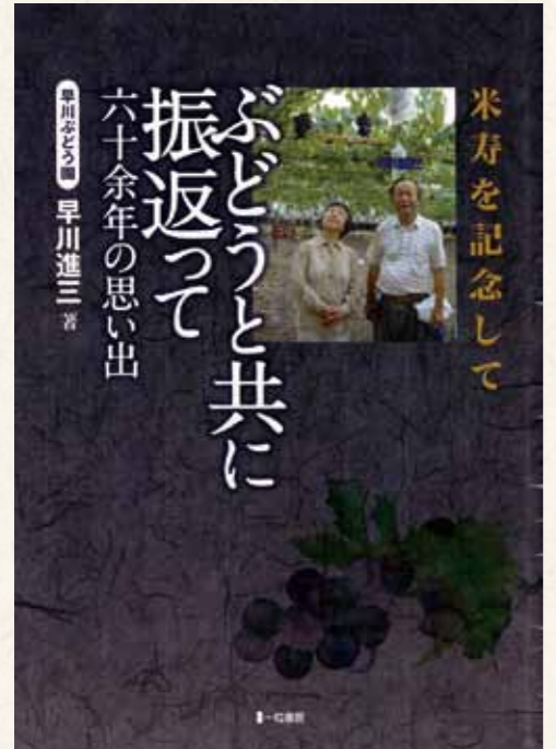
(昨年、米寿を記念して発刊した著書)