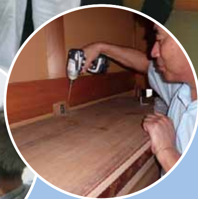
家具転倒防止金具取付も支援