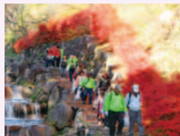
▲ハナモモの種収穫中

当所は商業部会の下部組織として「健幸の黄色い花プロジェクト」を設置し、「花いっぱい運動」を推進しています。本年3月には、あいち健康の森公園に「ハナモモの木」60本を植樹しました。今回は、子どもの緑化意識向上とハナモモの苗供給を目的に「親子によるハナモモの種収穫体験会」(参加者:大人33名+子供19名)を実施しました。