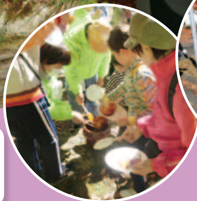
五平餅の調理体験中！