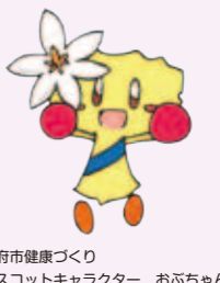
大府市健康づくり マスコットキャラクター おおぶちゃん

健康おおぶを世界に発信! 第45回大府市産業文化まつり 10月25日(土)・26日(日) 時:9:30～16:00(26日は15:30まで) 於:大府市民体育館・駐車場及び横根公民館