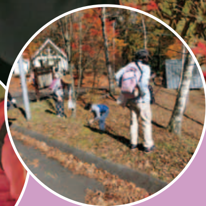
きのこ採り真っ最中！