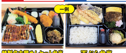
特製名古屋めしセット弁当