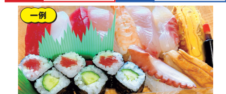
持ち帰りランチ(にぎり1人半)